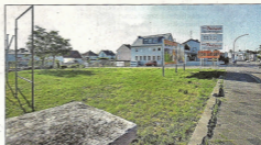
Wormser Landstraße: Die Freifläche ist ein Teil des Geländes.

zent der Fläche würden mit Tieflagen unterbaut, so Schwartz, der als Vorteil davon die Reduzierung des Verkehrslärms nennt. Zur Wormser Landstraße hin schwebt GeRo ein Mehrfamilienhaus vor, in dem es generierten Wohnraum mit begrenzten Mieten geben könnte. „Wir würden uns dazu in gewisser Weise verpflichten, wobei diskutiert werden muss, in welchem Umfang“, so Gehlein. Dahinter kämen ein weiterer Block parallel zur Wormser Landstraße und drei Blöcke entlang des erhöhten Bahndamms, die drei Vollgeschoss plus Dachgeschoss die höchsten Teile wären. Nach hinten zum Rofsprung hin abgestuft: erst sechs Reihenhäuser, dann mindestens sechs Doppelhausanlagen.